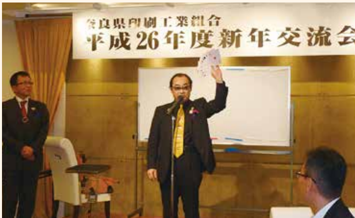
カードマジック中のみちみちミッチー氏