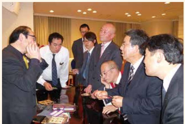
マジックグッズの説明を聞く皆様