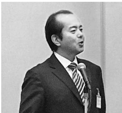
臼田全印工連会長