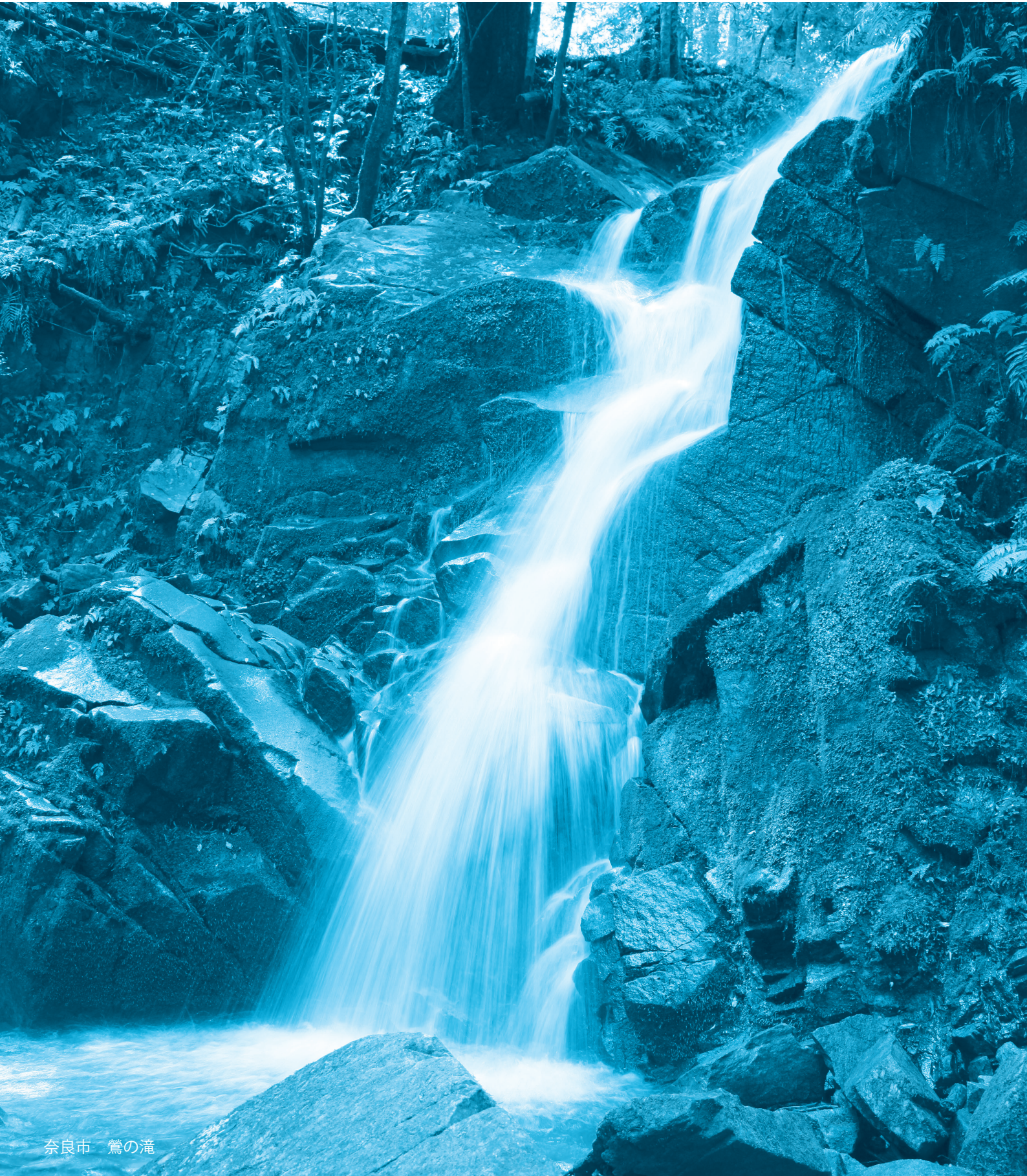
(題字筆 池田源太・奈良教育大学名誉教授)

奈良県印刷工業組合 〒630-8215 奈良市東向中町6 TEL 0742-26-5474 FAX 0742-95-5321 http://www.nara-inko.or.jp/