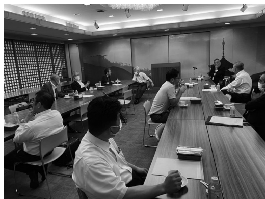
理事会・情報交換会の様子

7月10日(金) 奈良県経済倶楽部5階で午前10時から理事会・情報交換会を開催しました。