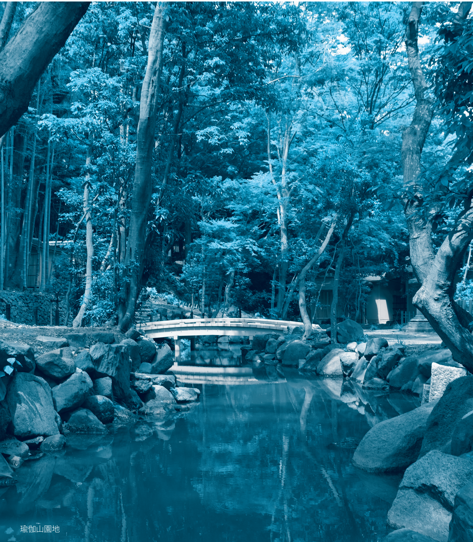
(題字筆 池田源太・奈良教育大学名誉教授)

奈良県印刷工業組合 〒630-8215 奈良市東向中町6 TEL 0742-26-5474 FAX 0742-95-5321 http://www.nara-inko.or.jp/